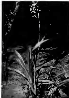
Pl. 4. — Eulophiella Rœmpleriana (Rchb. f.). Schltr : portion d'inflorescence, port de la plante.